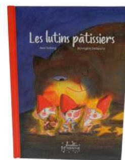
Livre Les lutins pâtissiers