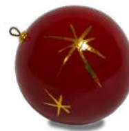
Boule de Noël Emaux de Longwy

Toutes les idées cadeaux sont à retrouver directement en boutique ou sur boutique.tourisme-metz.com