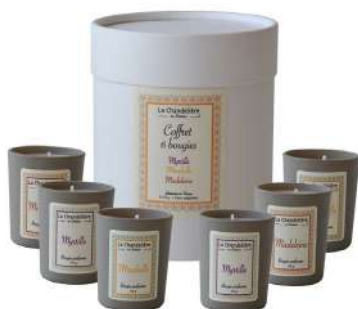
Bougies La Chandelière