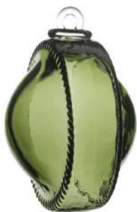
EXTRA Boule de Meisenthal édition 2022