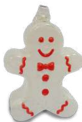
Boule de Noël Cristal Lehrer